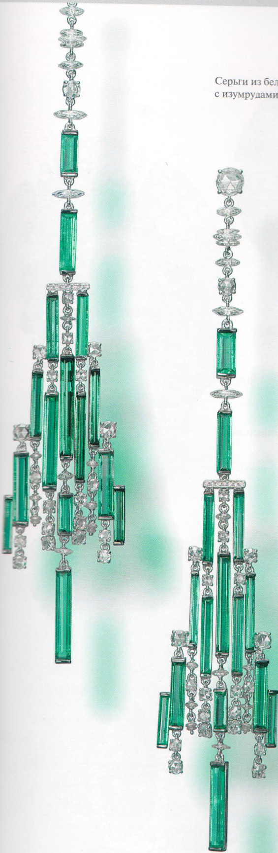
Серьги из белого золота с изумрудами и бриллиантами