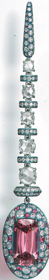
Серьги из белого золота и титана со шпинелями и бриллиантами