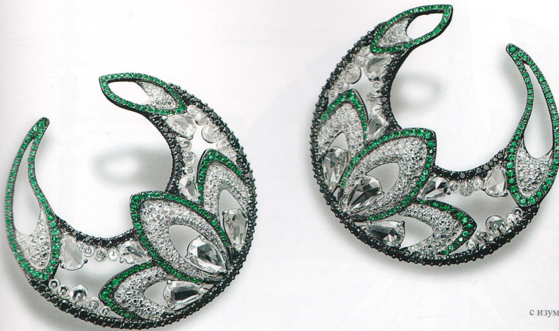
Серьги из белого золота с изумрудами и бриллиантами