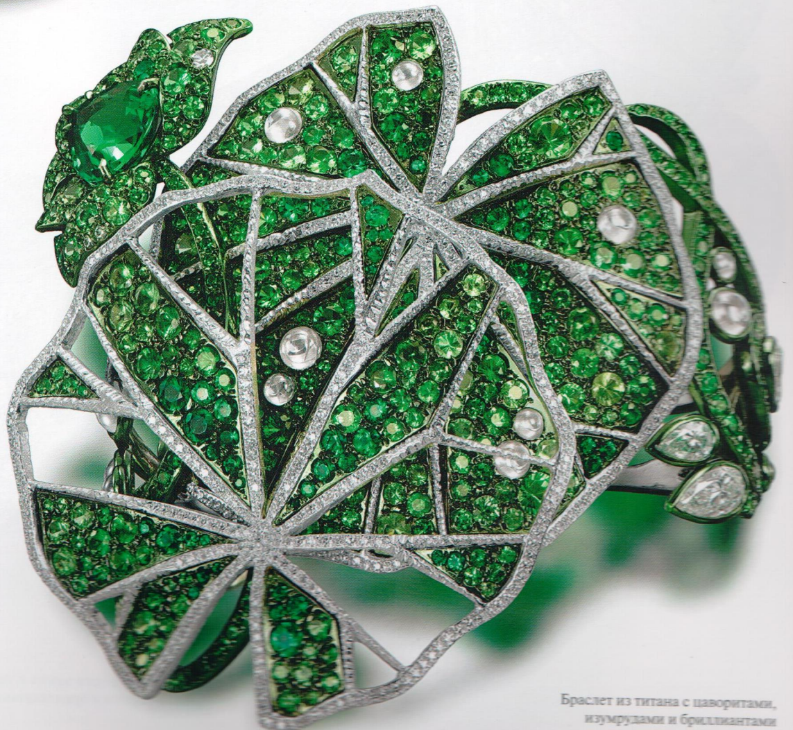
Браслет из титана с цаворитами, изумрудами и бриллиантами