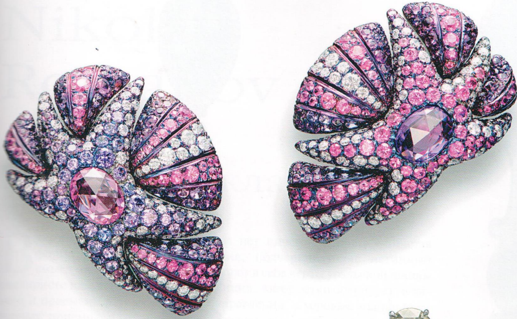
Серьги из белого золота и титана с аметистами, сапфирами и бриллиантами