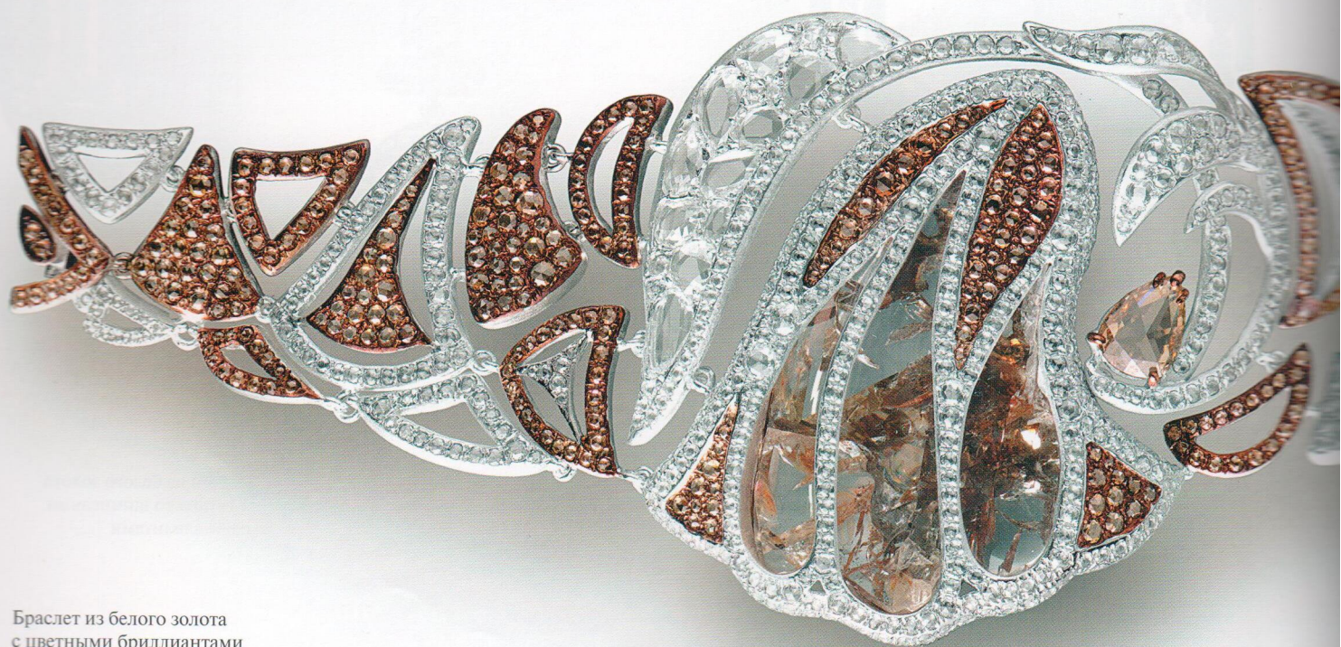
Браслет из белого золота с цветными бриллиантами