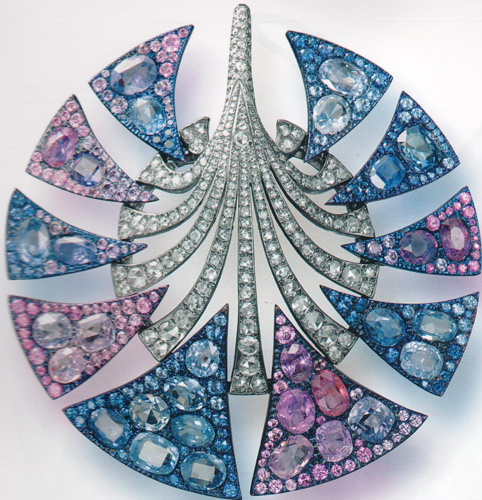
Брошь-подвеска из золота и титана с сапфирами и бриллиантами