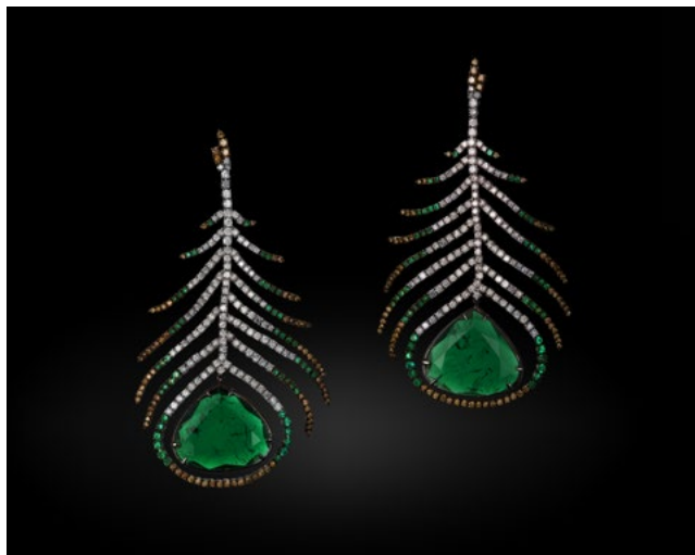
祖母绿耳坠，配以白钻、啡钻及灰钻，镶18K白金及钛金属