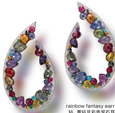
rainbow fantasy earrings, 白钻、黑钻、黄钻及彩色宝石耳环，镶18K白金

正是由于王幼伦对珠宝艺术创作的执着与敏锐，2006年，当时大热电影《达芬奇的密码》主创找到王幼伦，询问她是否愿意为这部电影做设计。作为丹·布朗的书迷，一想到可以亲自设计故事中的那些标志性物件，王幼伦高兴得难以言喻，立刻答应下来。最终，王幼伦为这部电影设计了四件作品：The Cross（镶13颗黑钻白金别针）、The Circle Cross（正十字别针）、The Fleur de Lys（雕刻铂金别针）、The Fleur de Lys Cross（钢铁十字钥匙吊坠）。这些作品受到了主创人员的高度肯定和赞赏，奥斯卡影帝、《达芬奇的密码》男主角汤姆·汉克斯向王幼伦表达了自己对那枚黑钻别针的喜爱，还开玩笑说得到它后仿如进入了电影当中那个神秘的宗教组织。