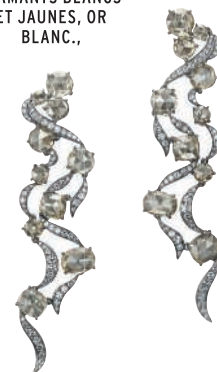
BOUCLES D'OREILLES "DANCING RIBBONS", DIAMANTS BLANCS ET JAUNES, OR BLANC.