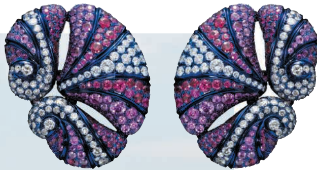
BOUCLES "OCEAN DREAM", DIAMANTS BLANCES, RUBIS, SAPHIRS ROSES SUR OR BLANC ET TITANE.