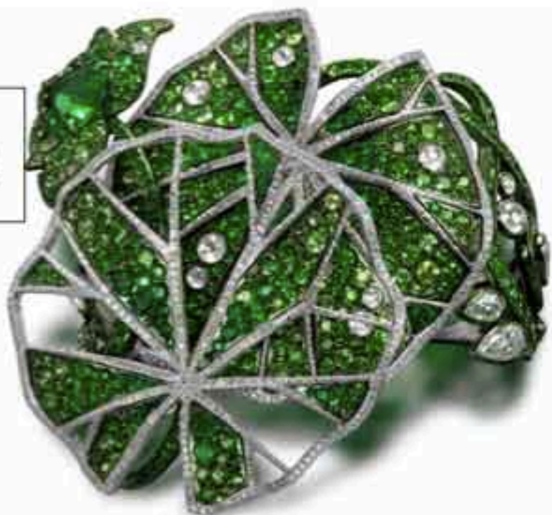
Браслет из титана с изумрудами и рубинами и бриллиантами