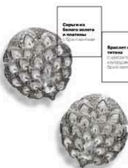
Серьги из белого золота и платины с бриллиантами