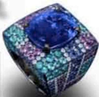
Кольцо из белого золота и титана с сапфиром, зелеными турмалинами, сине-зелеными слюдистыми сапфирами и бриллиантами