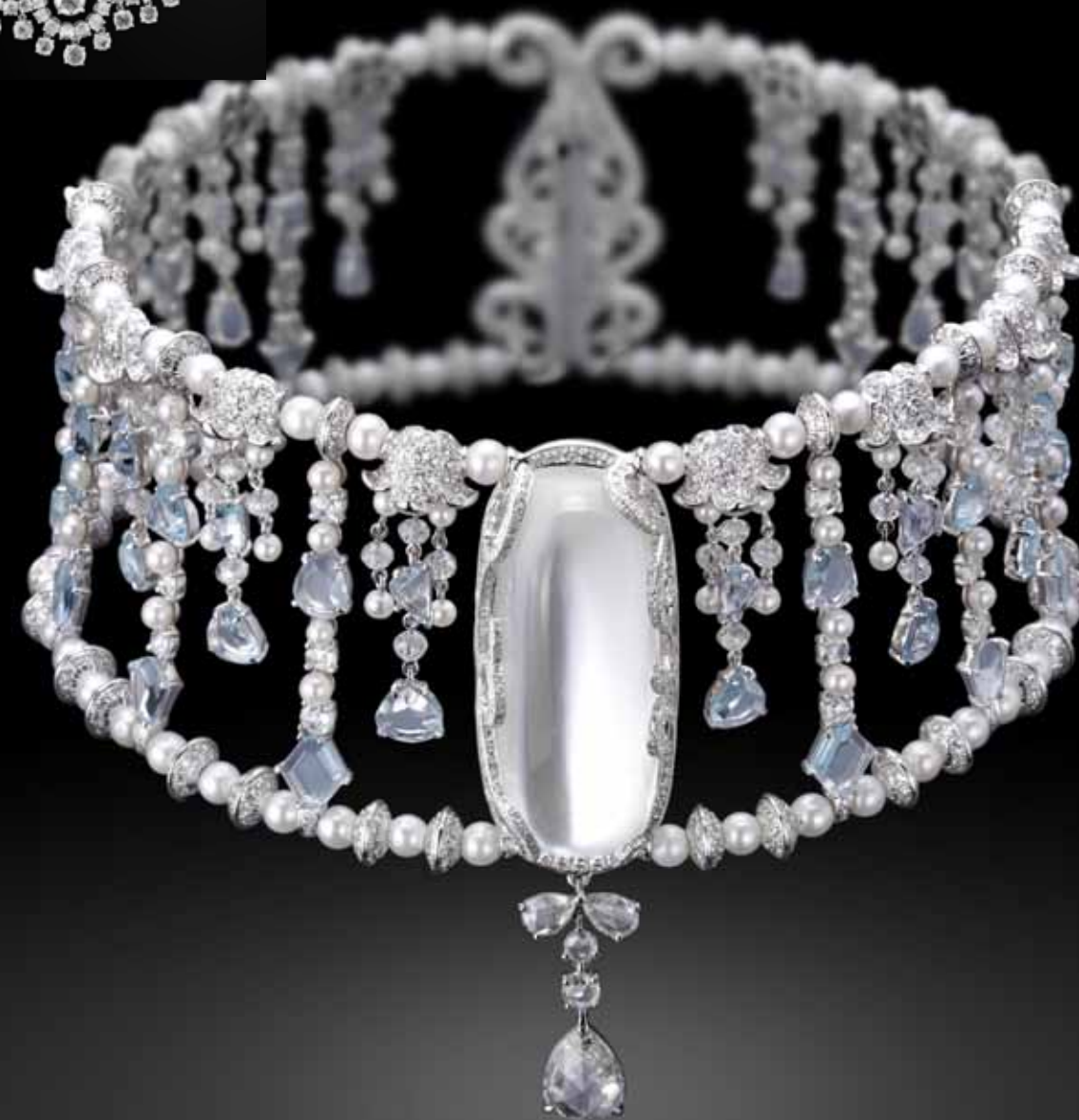
Колье-ошейник из белого золота с лунными камнями, жемчугом и бриллиантами