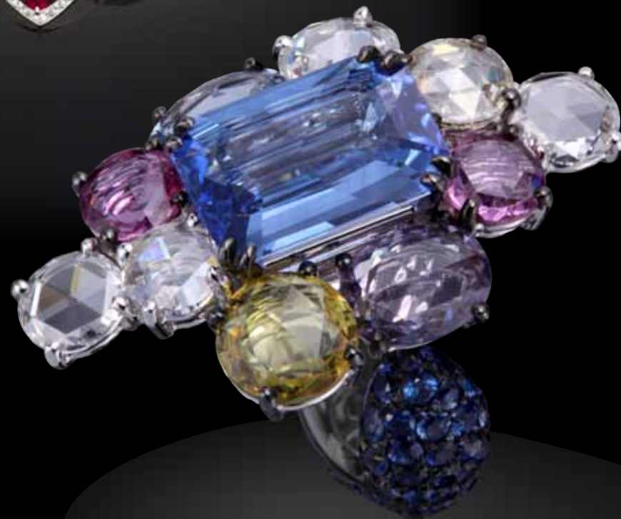
Кольцо из черного золота с разноцветными сапфирами