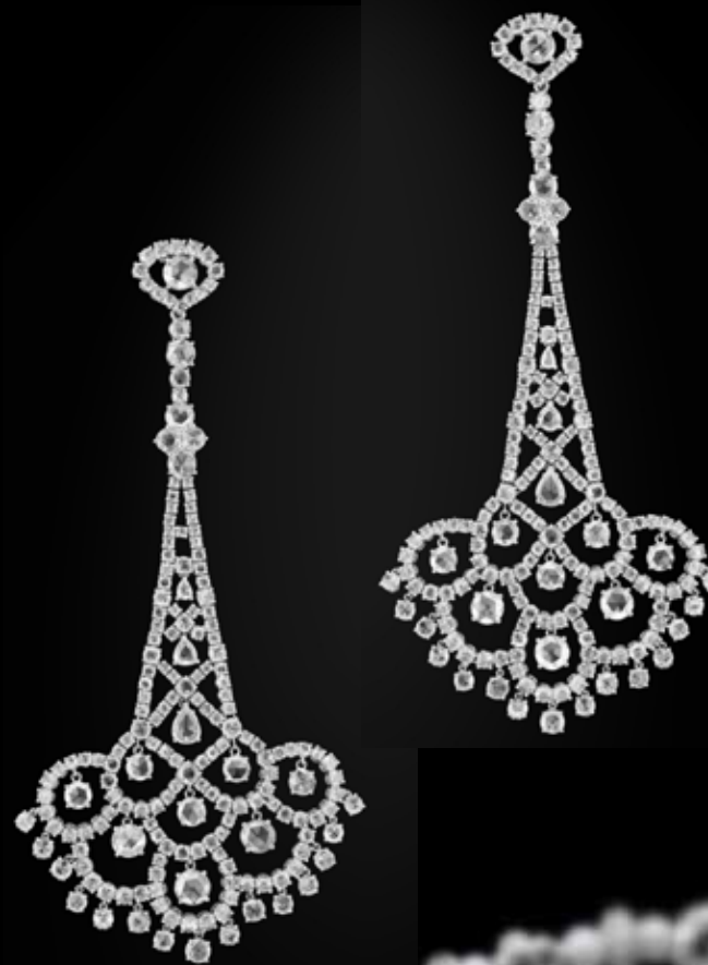
Серьги из белого золота с бриллиантами