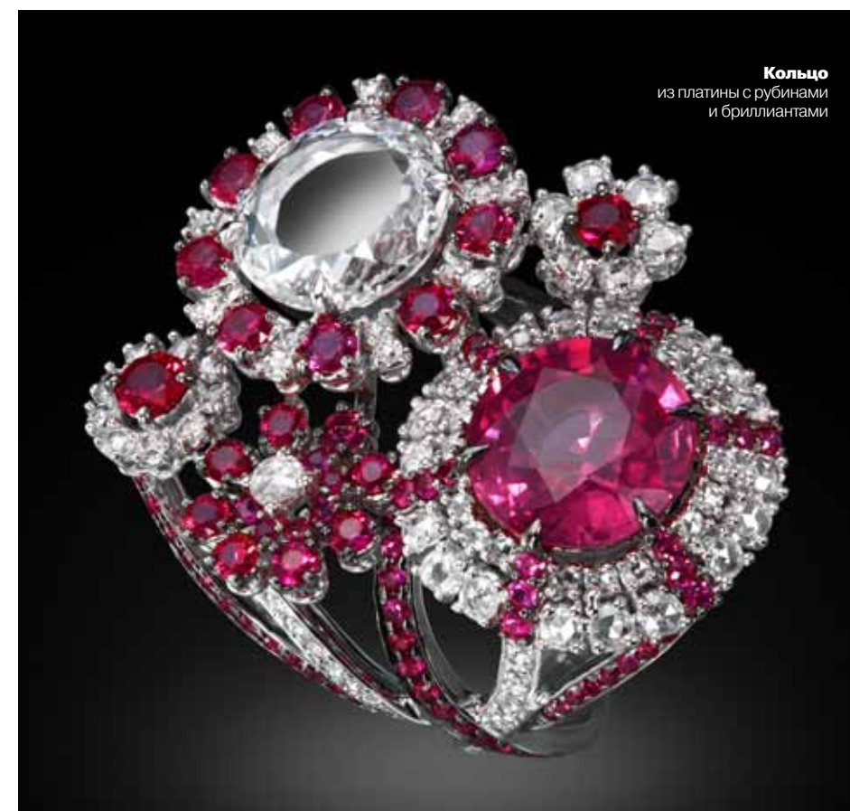
Кольцо из платины с рубинами и бриллиантами

да не задумывалась о географии творчества – вдохновение может прийти откуда угодно. К примеру, я использую много китайских мотивов и символов – драконов, облака... Тем не менее, не могу сказать, что моя эстетика привязана к какому-то месту. Мне хотелось бы видеть Carnet ювелирным домом, у которого есть поклонники и коллекционеры во всем мире».