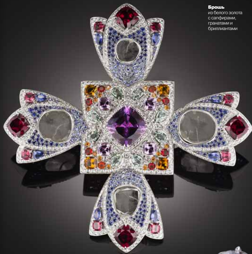
Брошь из белого золота с сапфирами, гранатами и бриллиантами