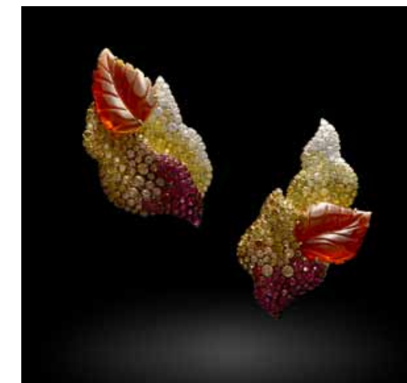
Серьги из желтого золота с резным огненным опалом, сапфирами и бриллиантами